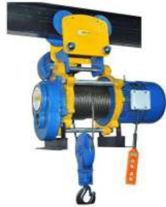
Monoraj Vinç Monorail Crane