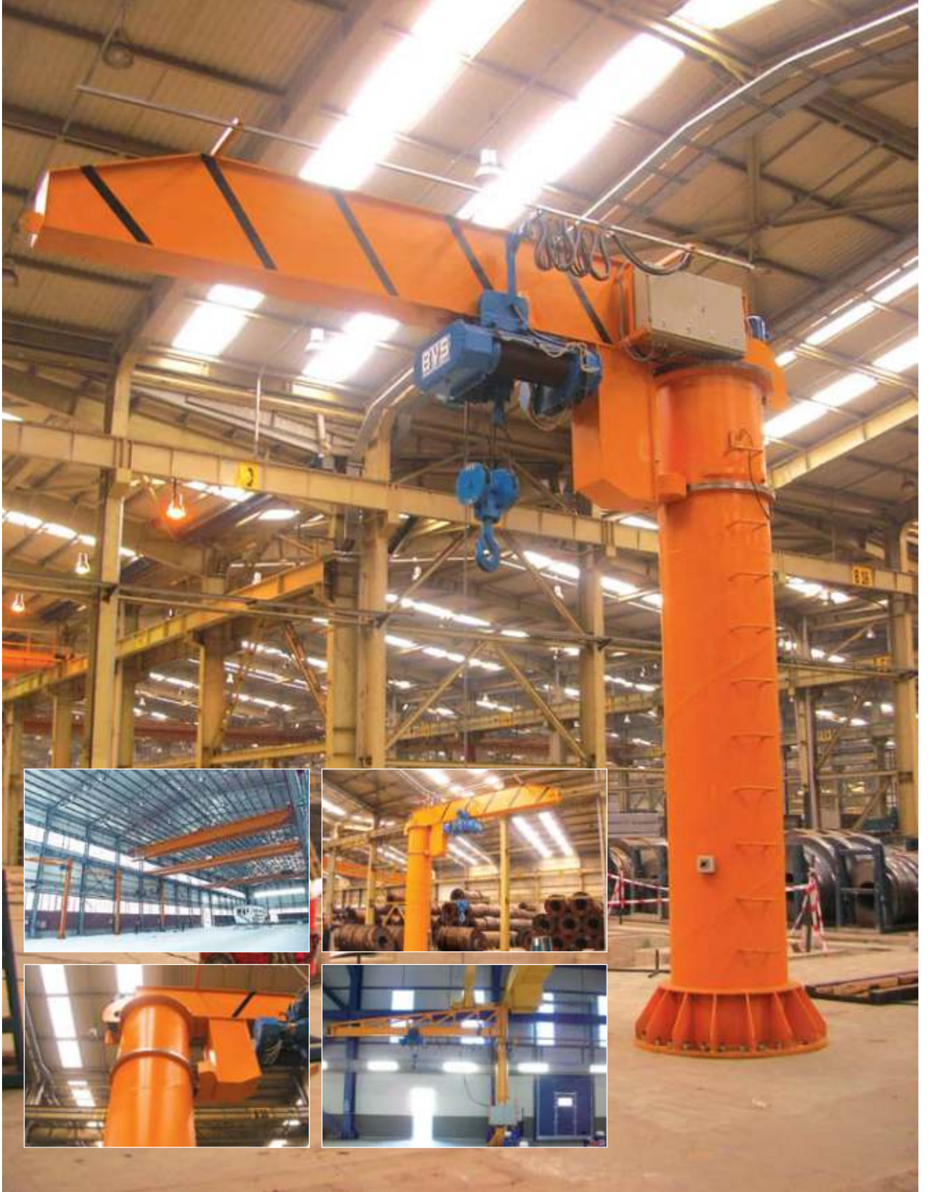
NOKSEL ÇELİK BORU / 8 ton 6 m. kol uzunluğu NOKSEL STEEL PIPE / 8 tons 6 m. arm length