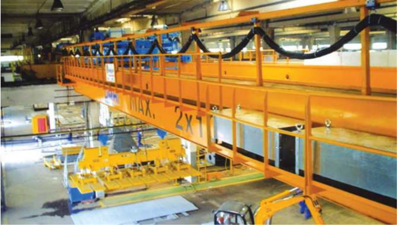
2x10 ton 30 m. (Döner arabalı vinç) 2x10 tons 30 m. (Turning hoist group)