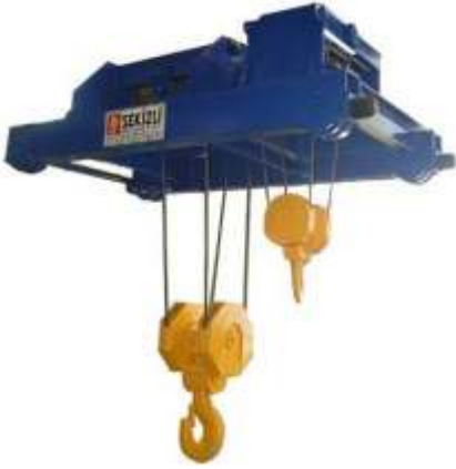
Yardımcı Kancalı Arabalı Vinç Trolley With Auxiliary Hook