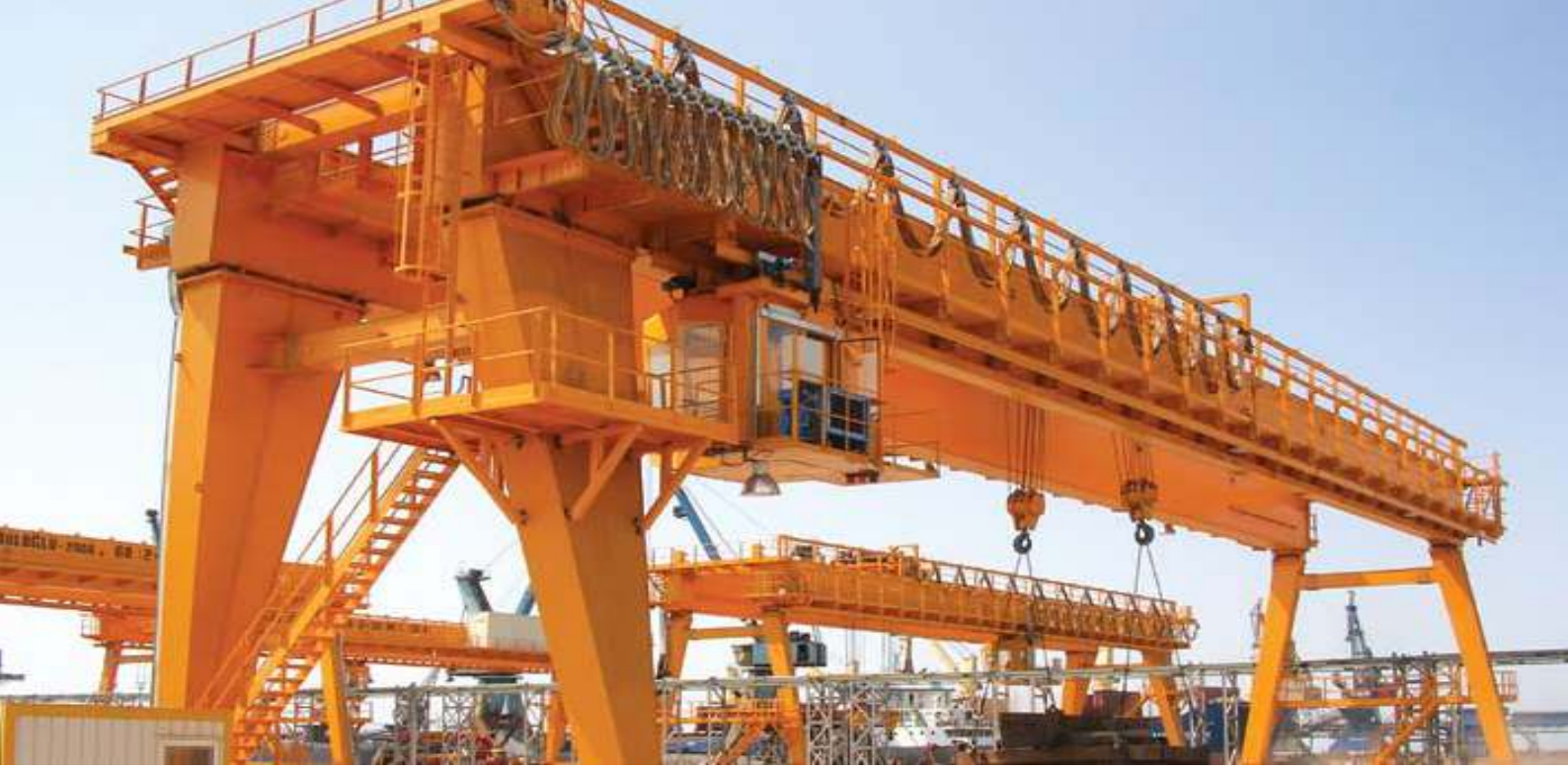
60 (2x30) m. Portal Vinç 60 (2x30) m. Gantry Crane