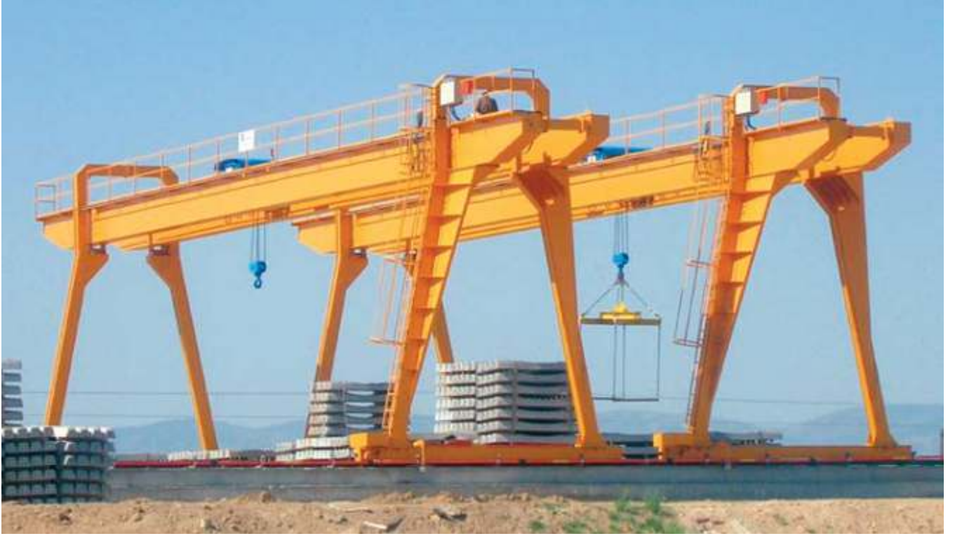
HIZLI TREN PROJESİ, 12.5 ton 25+5+5 m. portal vinç WORKSITE, 12.5 tons 25+5+5 m. gantry crane