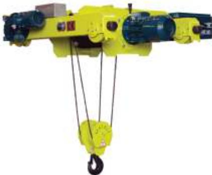
Düşük Tip Arabalı Vinç Low Type Intermediate Crane